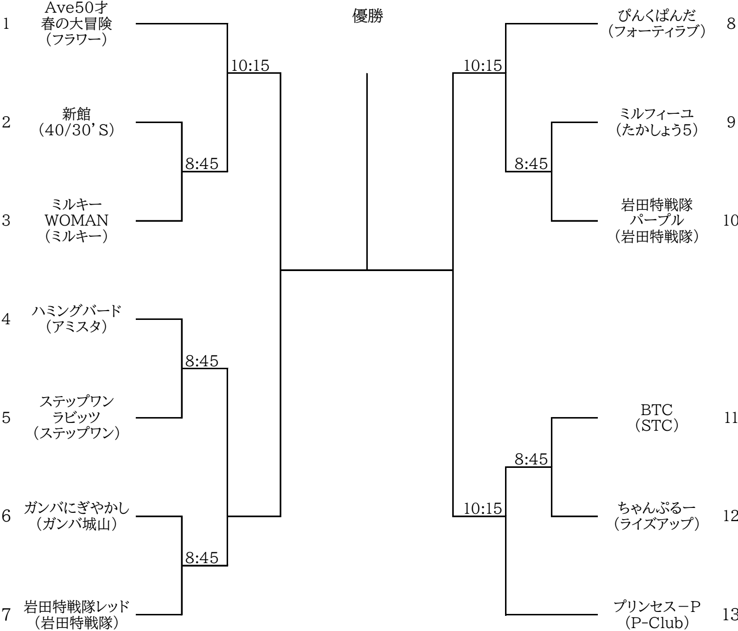
第1シード Ave50才春の大冒険(フラワー)